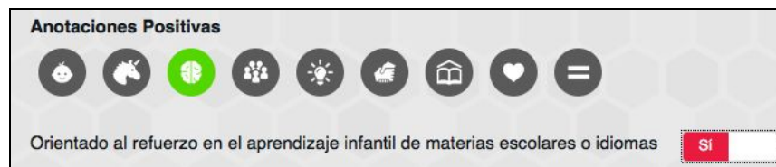
Figura 6: Anotaciones en positivo

El etiquetado puede completarse con anotaciones en positivo (Figura 6), del mismo modo que ocurre pinchando sobre uno de los pictogramas, aparece una descripción de la anotación seleccionada y un botón que permite añadir o quitar la anotación al recurso.