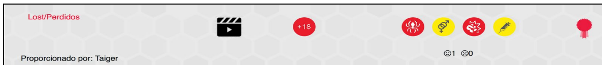
Figura 5: Ficha de resumen de un recurso

El etiquetado puede completarse con anotaciones en positivo (Figura 6), del mismo modo que ocurre pinchando sobre uno de los pictogramas, aparece una descripción de la anotación seleccionada y un botón que permite añadir o quitar la anotación al recurso.