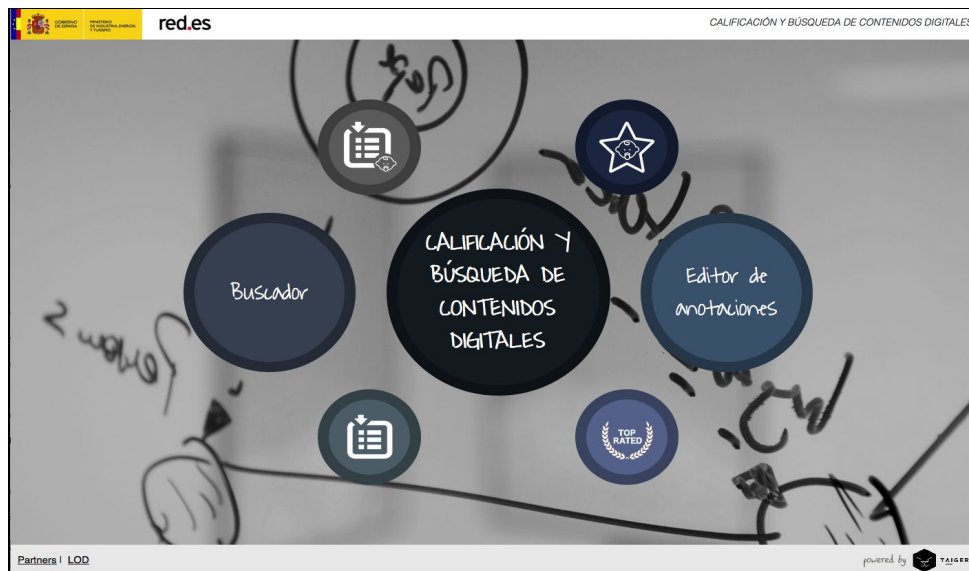
Figura 1: Página de inicio del portal de Etiquetado de Contenidos Digitales

Partiendo de la página de inicio, si el usuario pincha sobre el círculo de “Editor de anotaciones”, se abrirá una ventana solicitando su identificación (username y password) que previamente le habrá sido proporcionada por el administrador de sistema (Figura 1).